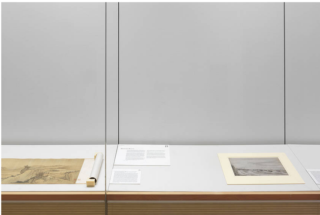
Themeninsel „Die Berge, nicht nah, nicht fern... – Landschaftszeichnungen des 17. Jahrhunderts aus den Niederlanden und China im Vergleich“