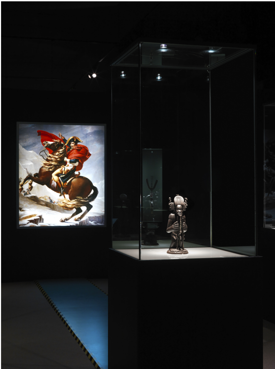
Themeninsel „Europa provinzialisieren – Der afrozentrische Blick“, Foto: Jens Ziehe