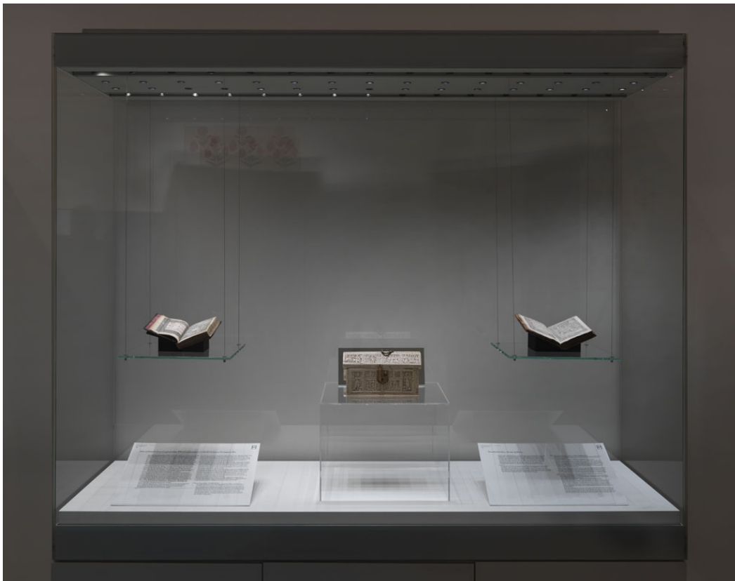
Themeninsel „Beziehungskästchen – Frühe Formen „globalisierter“ Kunst“