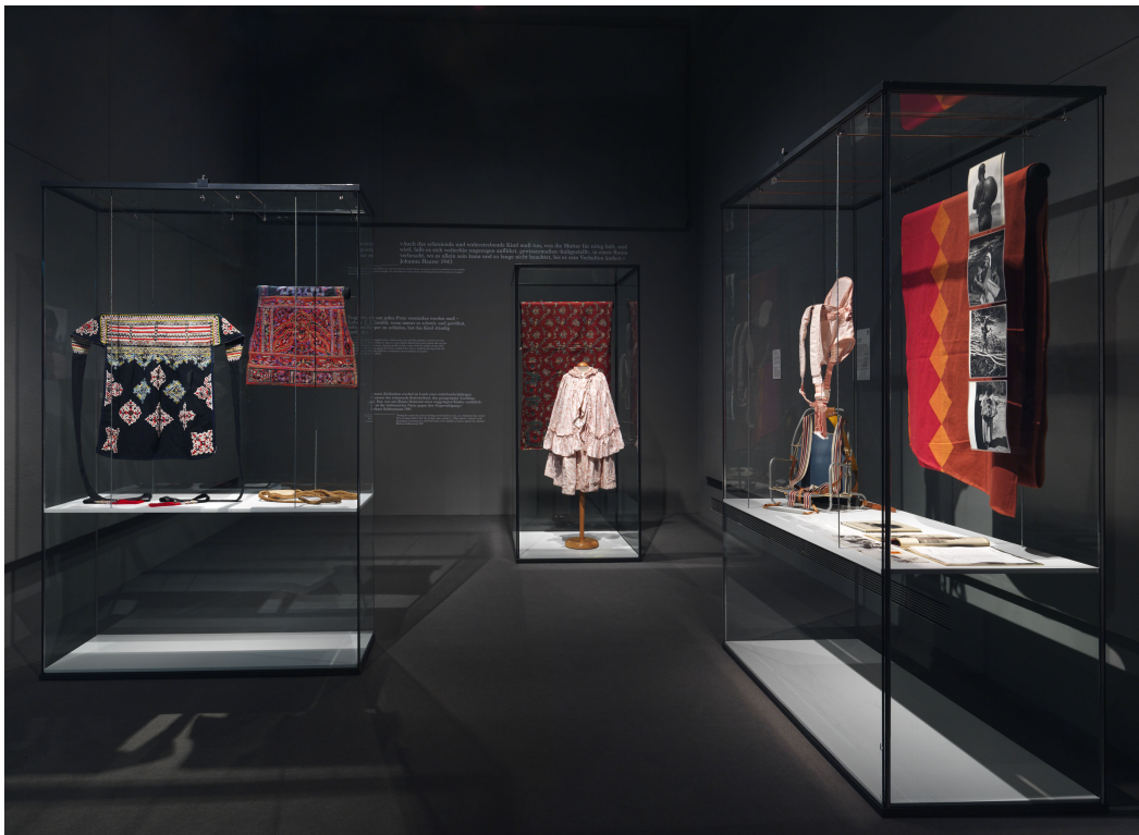
Themeninsel „Nach Europa getragen – Die (Wieder-)Entdeckung des Kindertragetuchs“, Foto: Jens Ziehe