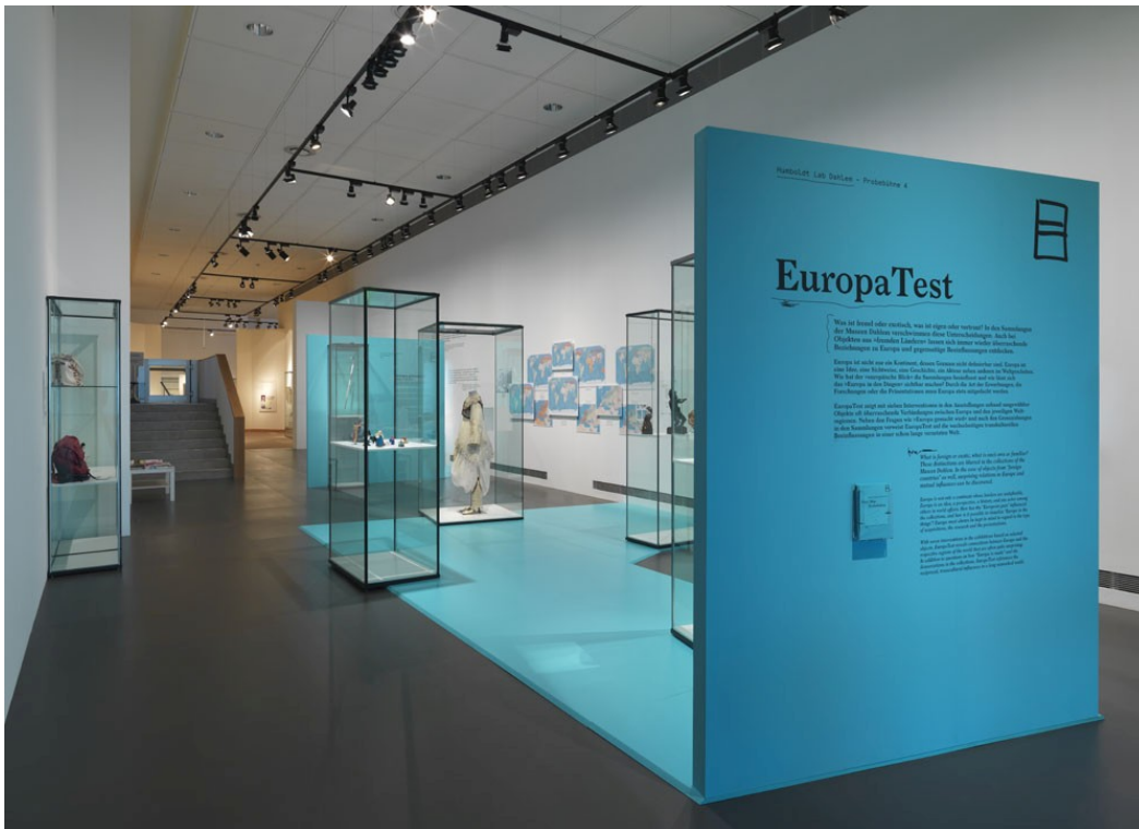
Themeninsel „Making Europe(s)“